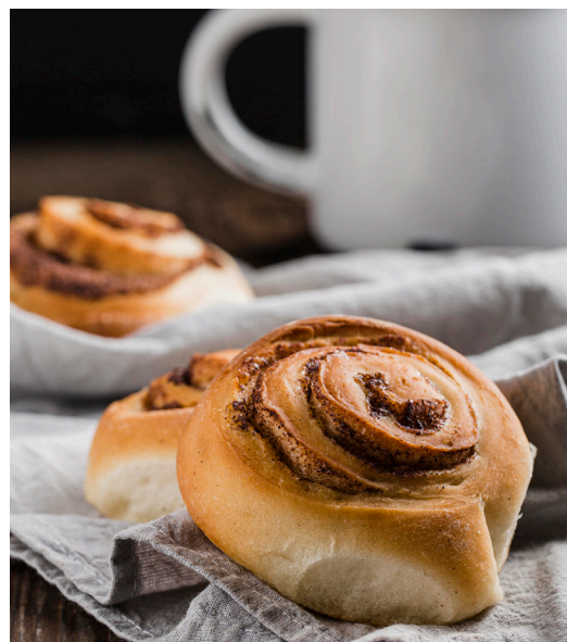
Fika är en viktig del av våra medlemskvällar.

Betala medlemsavgiften. Vi blir glada om du betalar din medlemsavgift (ifall du inte redan har gjort det) och meddelar din e-postadress. Det kostar 10 euro för vuxna och 5 euro för barn och studerande. Betala till Emmaus Ålands konto i Ålandsbanken FI32 6601 0002 3016 79 . Skriv namn, e-post och adress som meddelande.