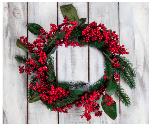
Den 28 november blir det julkransbinding i Norrböle med Mikaela Söderström.