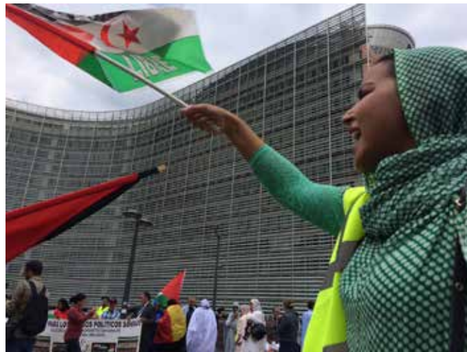
Emmaus Åland stöder Western Sahara Resource Watch, som bevakar västsahariernas rätt till sina naturtillgångar. Bilden är från en manifestation vid EU-kommissionen.