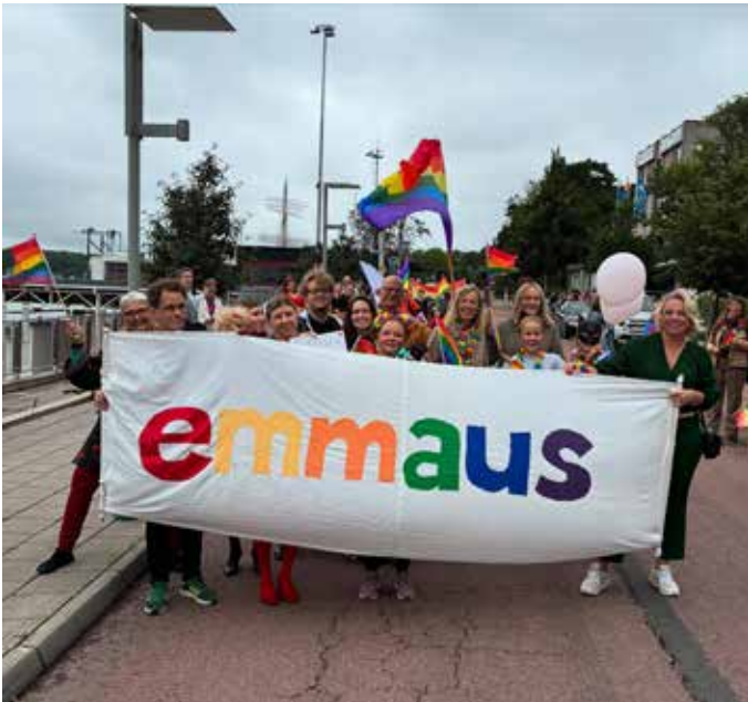
Emmaus Åland deltog i Prideparaden den 30.8.2025.