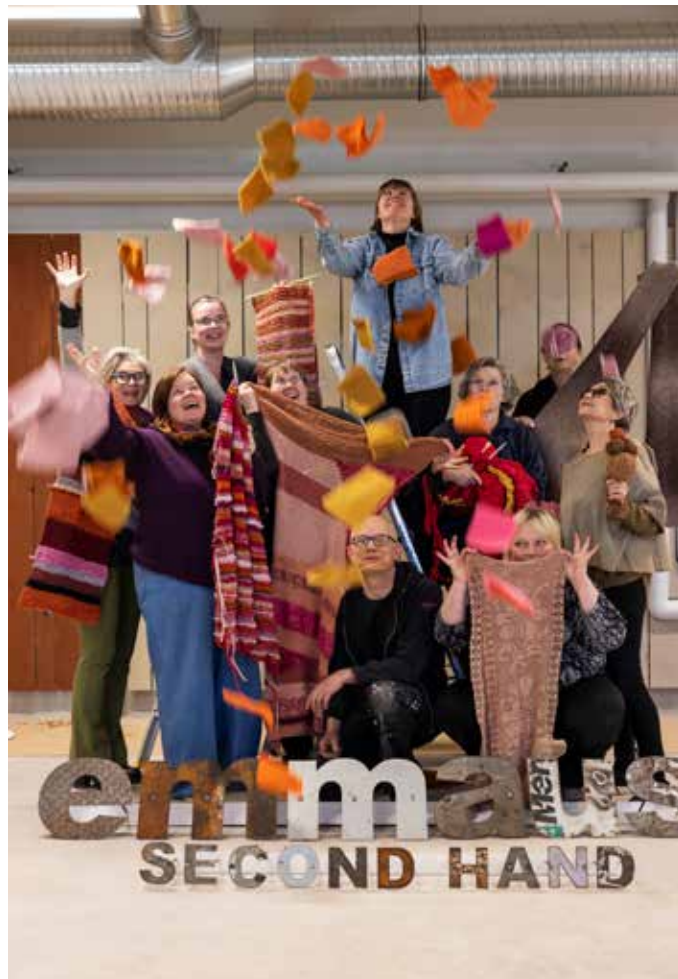
Hållbarhet och återbruk var några av ledorden när den förstörade Emmausbutiken i Norrböle planerades och inreddes i samarbete med volontärer. Butiken öppnade i maj 2025.

Kommunicera och bedriva påverkansarbete med grund i Emmausrörelsens värderingar och om Emmaus Ålands verksamhet.