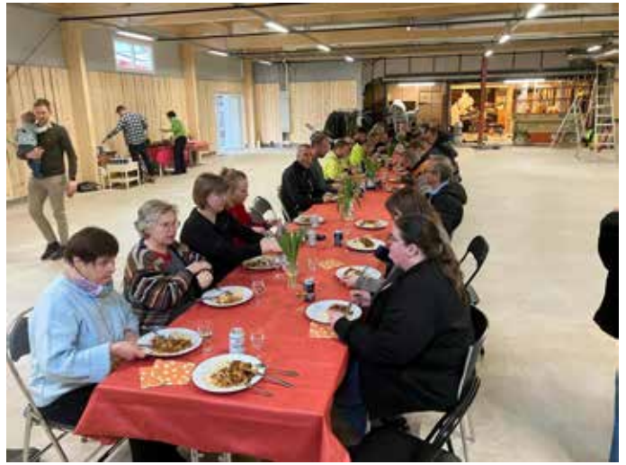
Taklagslunch i mars 2025 i butikstillbyggnaden i Norrböle.

Emmaus Åland äger samtliga aktier i FAB Emmaus Norrböle, som besitter fastigheten Skogshyddsvägen 7. Under 2023 uppgjordes en utvecklingsplan för Emmaus Norrböle med anledning av behov av mer ändamålsenliga lokaler samt med anledning av fuktskador i en av byggnaderna. Under 2024 inleddes arbetet med takrenovering samt tillbyggnad om ca 270 kvadratmeter. Renovering och tillbyggnad slutfördes våren 2025.