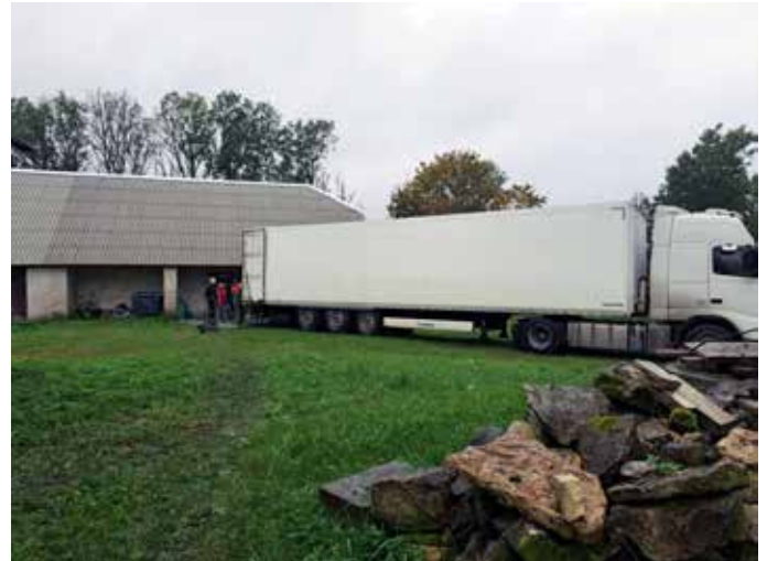
Biståndstransport till Elü Jaoks på Ösel, Estland i oktober 2025. Biståndstransporternas utsläpp har minskat i snabbare takt än planerat tack vare att biståndstransporterna har blivit färre.

Utsläppen från el och värme består i princip endast av utsläpp från fjärrvärmens på Strandgatan, eftersom Emmaus i övrigt köper grön el. Under 2025 skulle föreningen också utreda möjliga åtgärder för att binda koldioxid. Detta har inte gjorts.